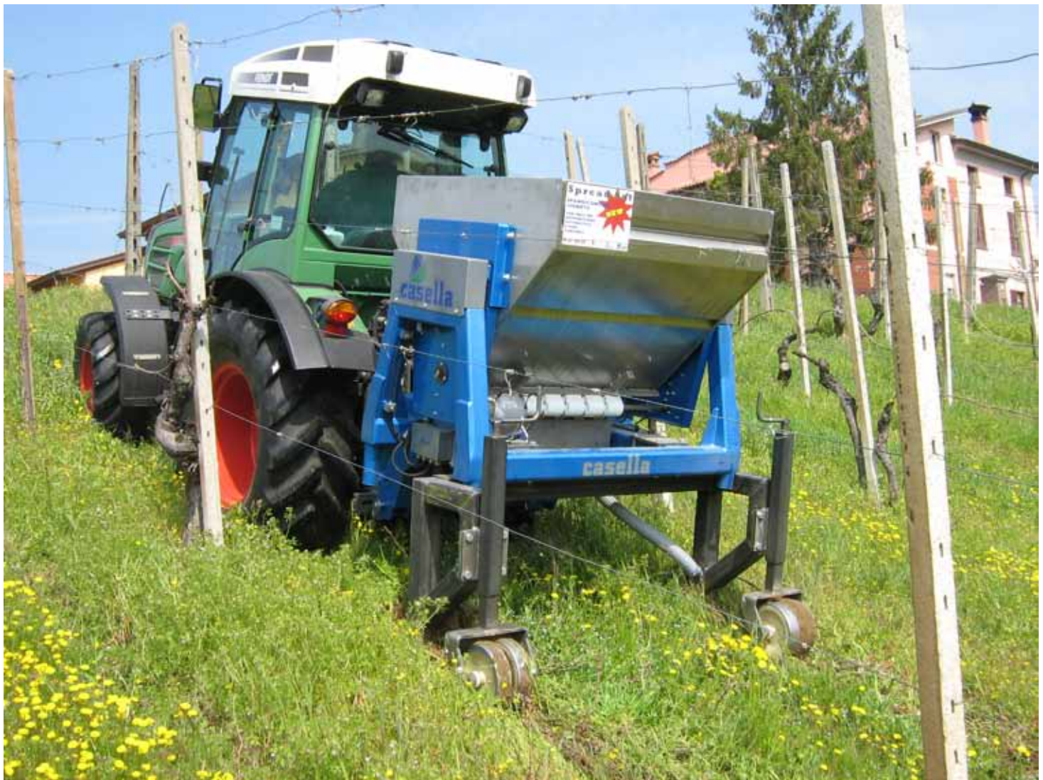
Lo spandiconcime in azione nel vigneto