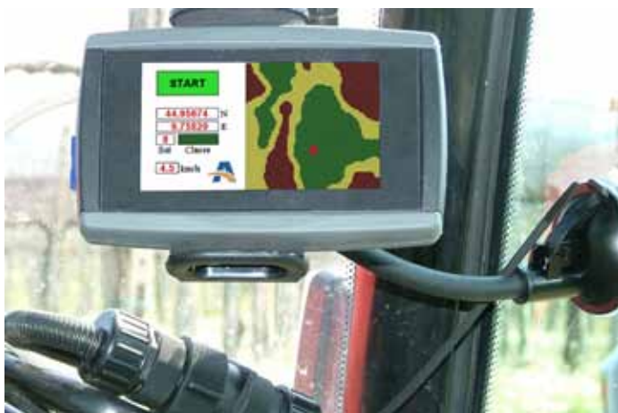
Dettaglio del terminale a bordo del trattore

APPLEBY ITALIANA SNC Via Emilia, 246/A 29010 Roveleto di Cadeo (PC) Tel. 0523 508920 Fax 0523 500483 info@precision-farming.com www.precision-farming.com